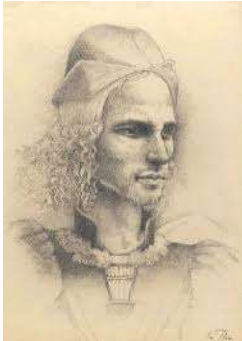
J. Roís de Corella (1435 – 1497)