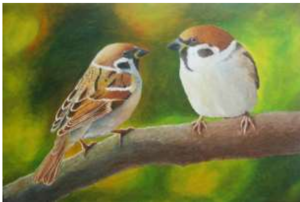
“Paseri” (2018), oleo-pikturo da © Ebrahim Shahin, artista de Unionita Araba Emirii.