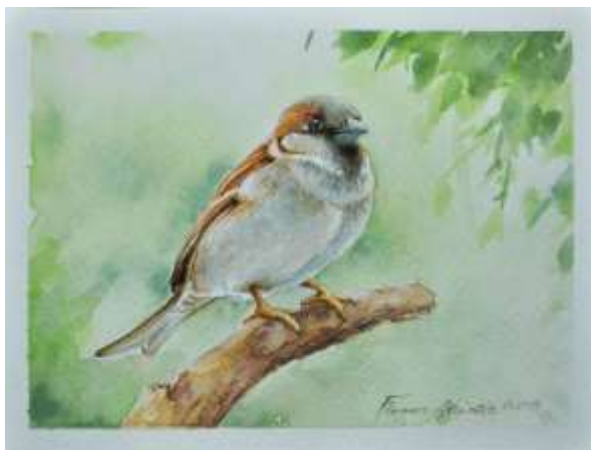
“Pasero” (2015), aquarelo da © Florans Atlantis (n. 1972), Iranana piktisto nun habitanta Istanbul, Turkia.

(tradukita ed adaptita da Partaka en 2008)