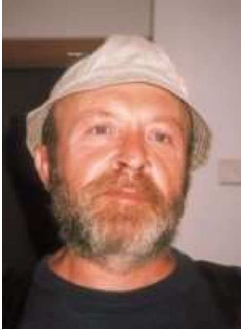
Partaka (n. 20ma y.c.)